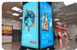
软膜 Soft Film