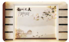
背景墙 Background Wall