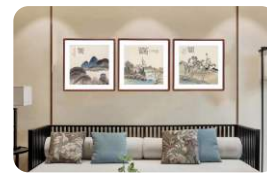
艺术画 Art Painting