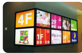
灯箱 Light Box