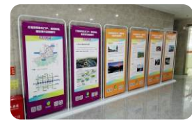
易拉宝 Roll Up Banner