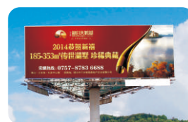
广告布 Advertising Cloth