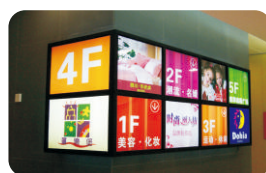
灯箱 Light Box