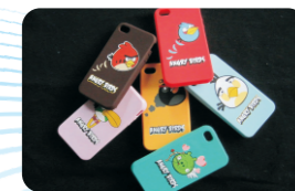
手机壳 Phone Case