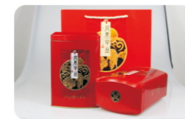
礼盒 Gift Box