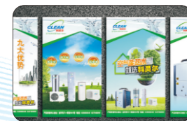
KT板 KT Board